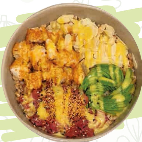
CROCCANTE BOWL* o ^ (15) Riso basmati, gambero in tempura, sashimi di tonno, avocado, mandorle, salsa senape e miele