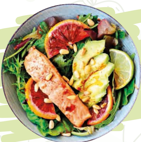
SALMON SALAD (14,5) Farro, ruculetta, avocado, salmone o* scottato, pinoli, arancia