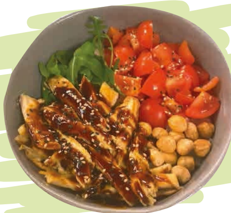
HAZELNUTS BOWL (14,5) Farro, pomodorini, pollo* alla piastra, ruculetta, nocciole, sesamo e salsa agrodolce