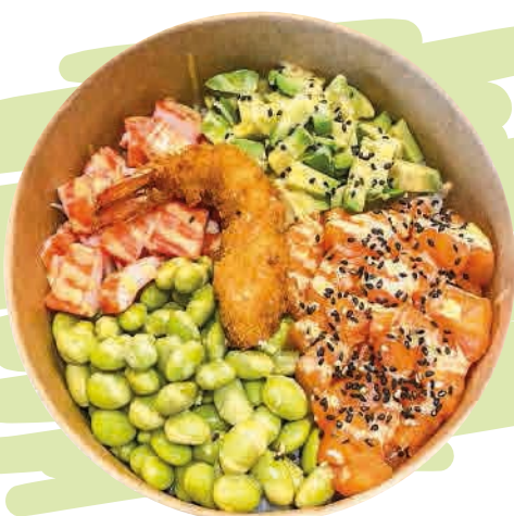
TEMPURA POKE BOWL* o ^ (15) Riso basmati, fagiolini di soia, salmone, gambero in tempura, granchio, avocado, salsa dello chef